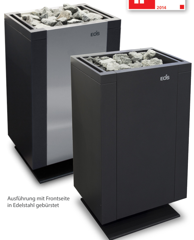
Ausführung mit Frontseite in Edelstahl gebürstet