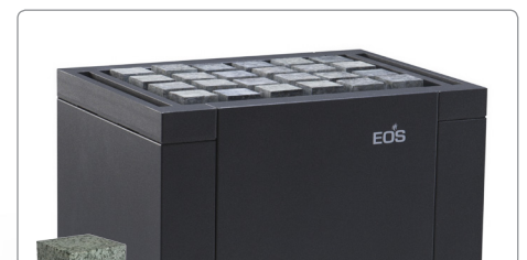
Optionale Cubic Steine