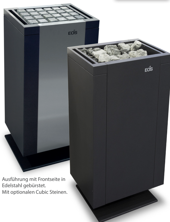
Ausführung mit Frontseite in Edelstahl gebürstet. Mit optionalen Cubic Steinen.