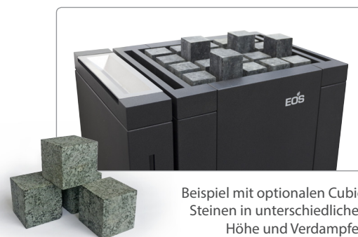
Beispiel mit optionalen Cubic Steinen in unterschiedlicher Höhe und Verdampfer